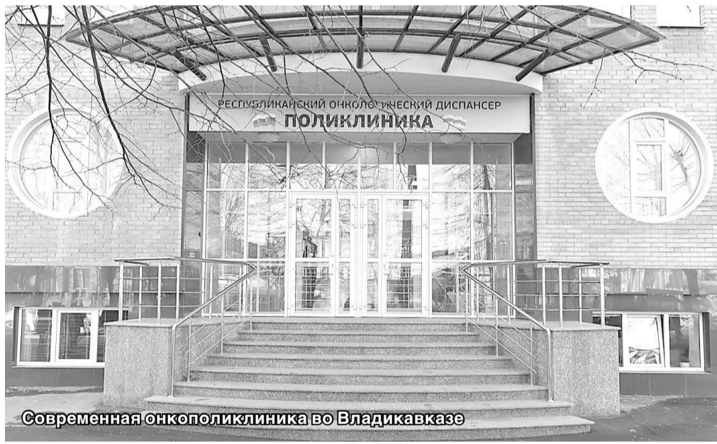
Современная онкополиклиника во Владикавказе

Мы не берем утверждать, что прежними руководителями не реализовывались аналогичные проекты. Но достоинство нынешнего