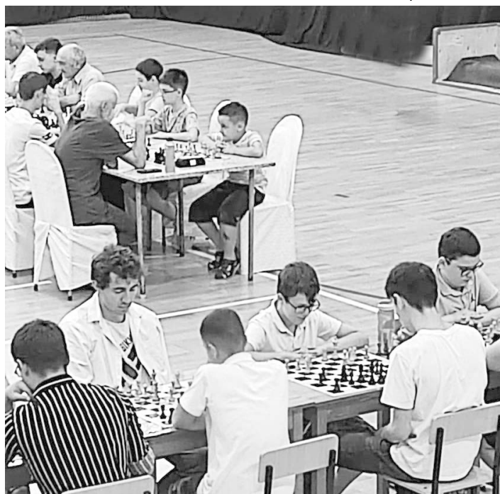
Чемпионат СКФО по быстрым шахматам, г. Черкесск, 17 июля 2022 года

Журнал иллюстрирован рисунками Артура Харбашвили.