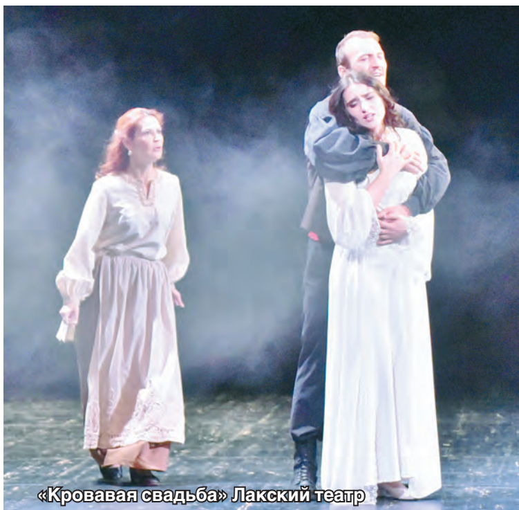
«Кровавая свадьба» Лакский театр

– Это не первый театр, в котором вы ставите «Кровавую свадьбу», до этого был театр из Дагестана. Сильно ли отличается работа сейчас?