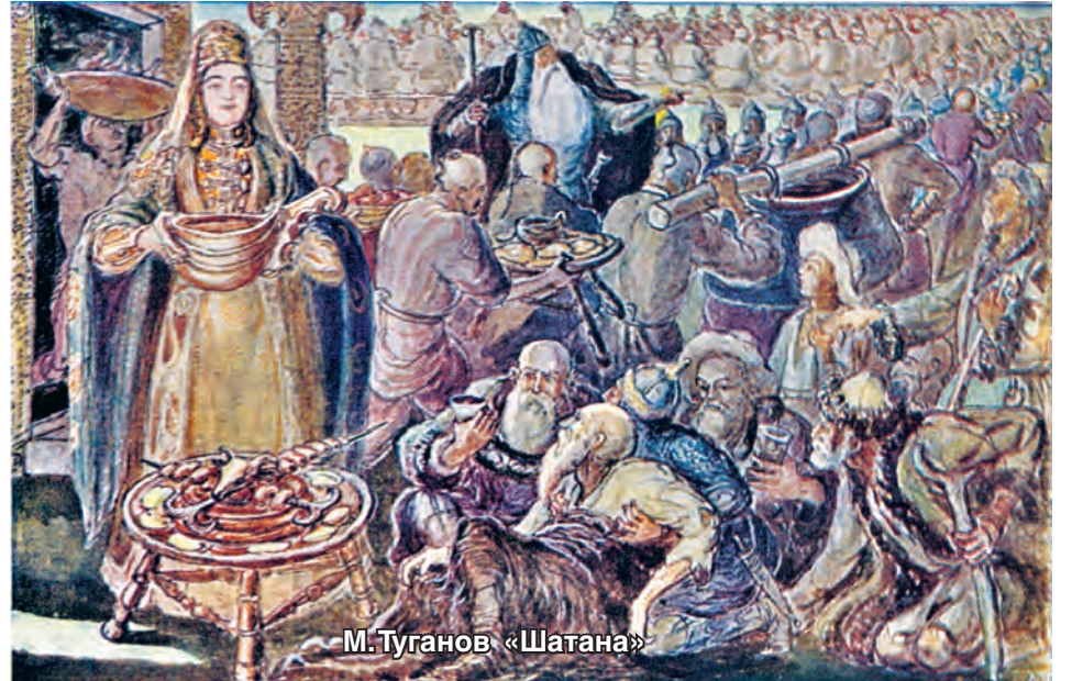
М. Туганов «Шатана»

Нарттовские женщины разборчивы, подчас капризны. Прежде чем дать согласие на брак, они испытывают своих женихов в