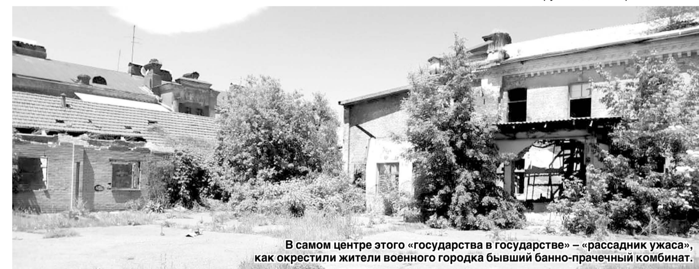
В самом центре этого «государства в государстве» – «рассадник ужаса», как окрестили жители военного городка бывший банно-прачечный комбинат.

«29-й военный городок – это все же территория города Владикавказа, где ничего не делается в плане ремонта коммуникаций, благоустройства территории, есть проблемы с электричеством, объектами недвижимости, парковками... одним словом, большой круг проблем, мешающих нормально жить горожанам», – считает руководитель регионального