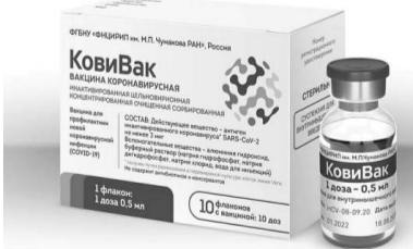
стрирована Министерством здравоохранения России 20 февраля 2021 года.

пресс-служба Министерства здравоохранения РСО-А.