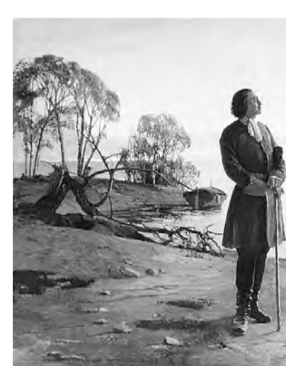
«Здесь будет город заложен». 1880 г. Николай Добровольский.

Концепция государственно-правового переустройства страны у