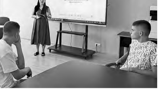
вопросы при подготовке к ЕГЭ по обществознанию.