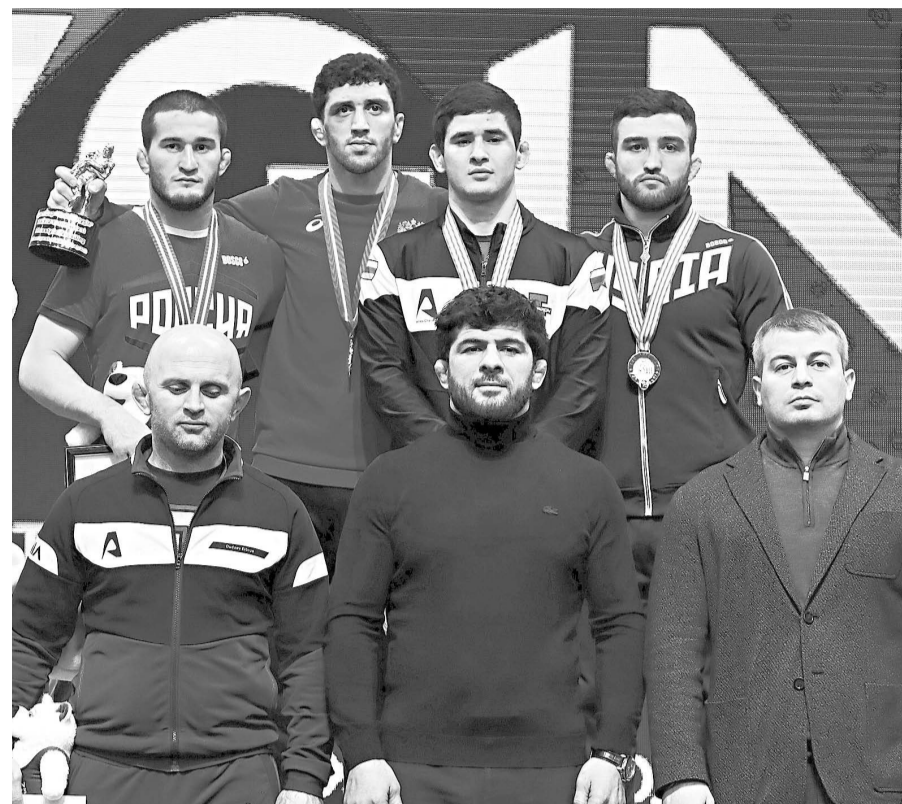
С 26 по 29 января в Красноярске прошел, по традиции, первый в новом году зимний старт вольников.