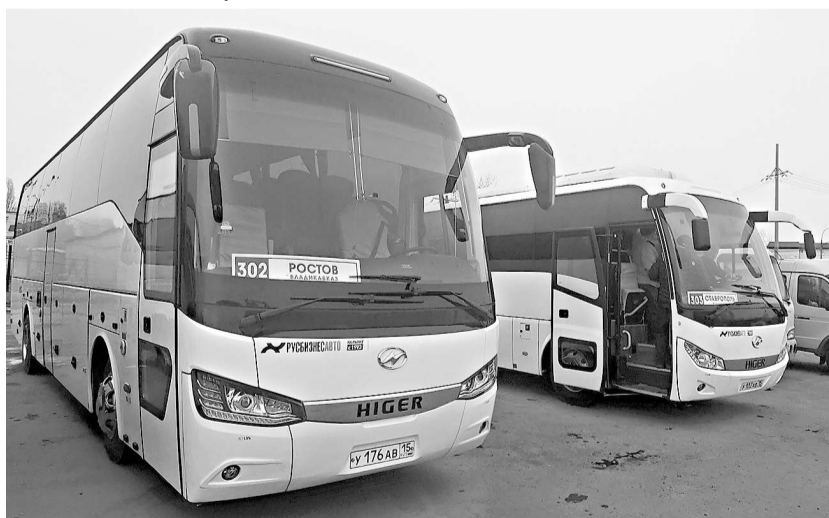
Тамара БУНТУРИ.

В 2022 году Северная Осетия приобрела 67 новых комфортабельных автобусов отечественного и китайского производства. Уже поступило 65. 40 машин марки «ПАЗ-Вектор-NEXT» будут обслуживать межмуниципальные маршруты, остальные 25 марки «HIGER» – межрегиональные.