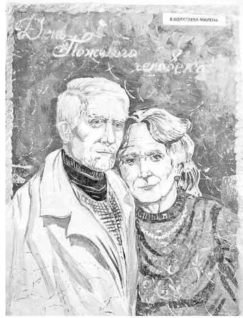
торжества не сдерживают улыбок, настроение у них приподнятое, светло: внимание всегда

приятно. К тому же, КЦСОН Ардонского района при отделении социальной помощи пожилым гражданам и инвалидам сделал все возможное, чтобы праздник удался на славу.