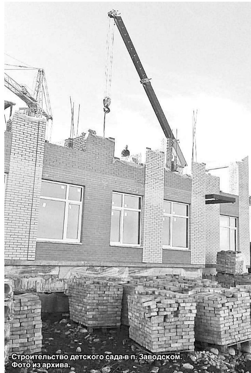
Строительство детского сада в п. Заводском.

Врио Председателя Правительства РСО — А Таймураз ТУСКАЕВ провел совещание с членами кабинета, на котором обсудили вопросы реализации в республике государственных программ и национальных проектов.