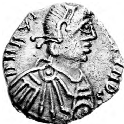
Изображение Гейзерика на серебряной монете