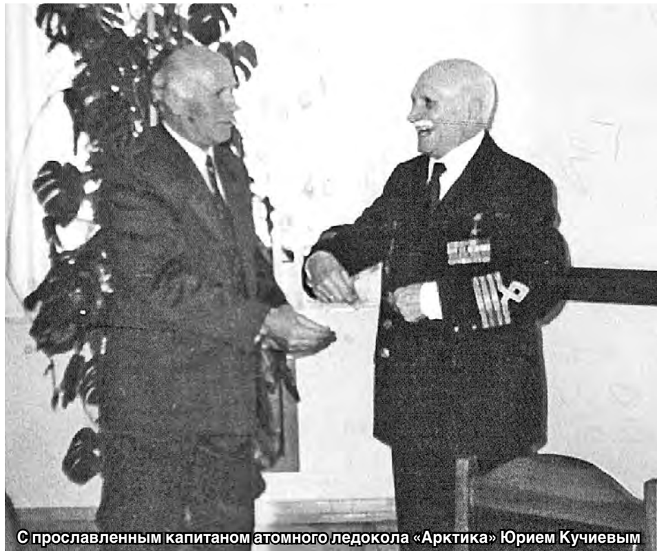
С прославленным капитаном атомного ледокола «Арктика» Юрием Кучиевым

— Недавно в стране впервые на таком высоком уровне отмечалось 30-летие смешанной миротворческой миссии. Чем, по-вашему, это вызвано?