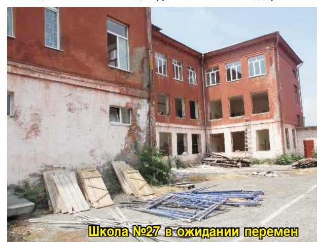
Школа №27 в ожидании перемен