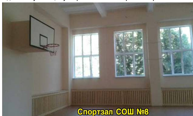
Спортзал СОШ №8