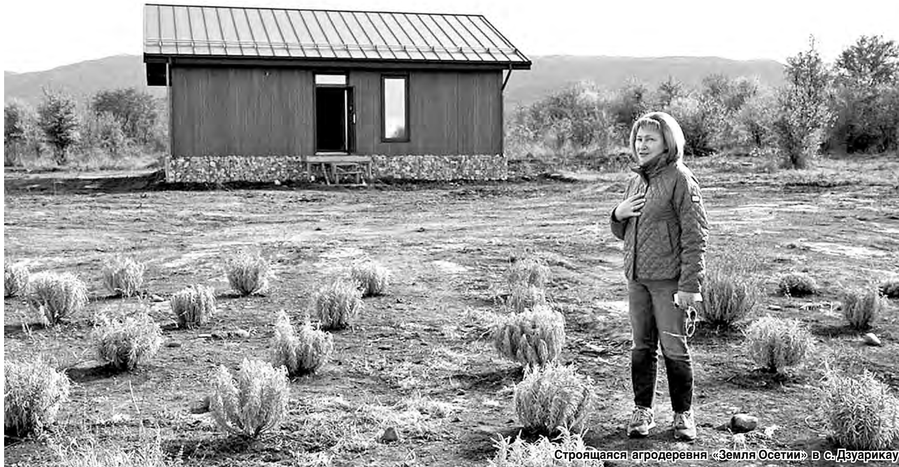
Строющаяся агродеревня «Земля Осетии» в с. Дзурикау

Агропромышленный комплекс в последние годы пользуется повышенным вниманием государства. Ликвидация продовольственной зависимости и наращивание экспорта заслуженно относятся к успехам проводимой в отношении АПК политики.