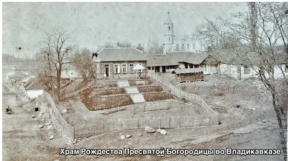
Храм Рождества Пресвятой Богородицы во Владикавказе