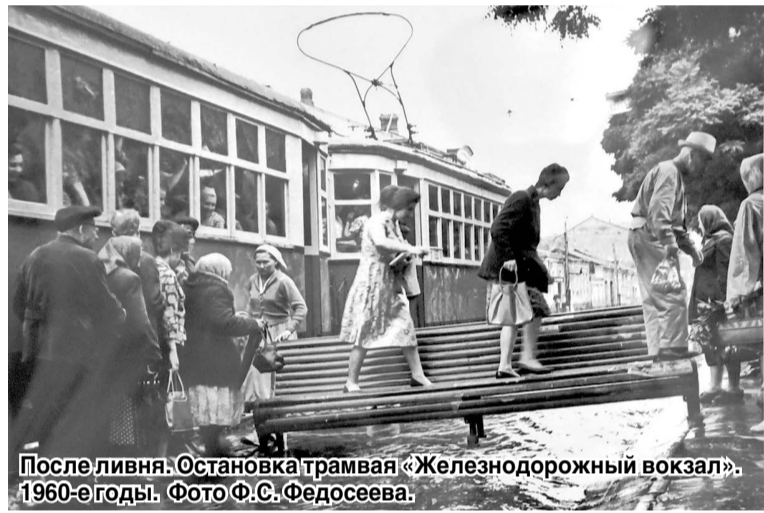
После ливня. Остановка трамвая «Железнодорожный вокзал». 1960-е годы.